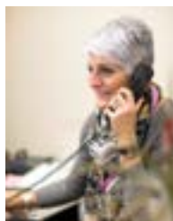
Assistants médicaux Secrétaires médicaux