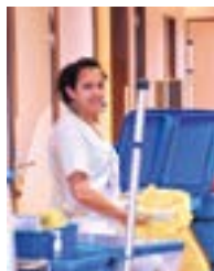
Agents de service hospitalier