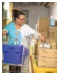
Personnel administratif et logistique