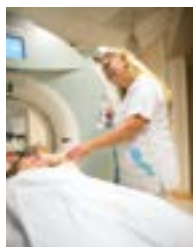
● Manipulateurs en électroradiologie