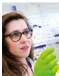
Attachés et techniciens de recherche clinique Chercheurs (recherche fondamentale, translationnelle et clinique)