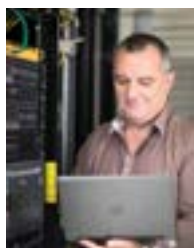
Personnels informatiques et techniques