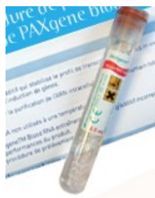
Tube PAXgene™ Blood RNA

Matériel utilisé (photo non-contractuelle) :