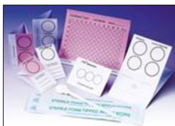
Carte Indicating FTA® Elute