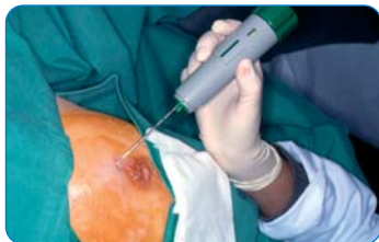
Microbiopsie guidée par échographie : l'aiguille pénètre dans la peau anesthésiée

N'hésitez pas à poser toutes les questions qui vous préoccupent à l'équipe médicale.