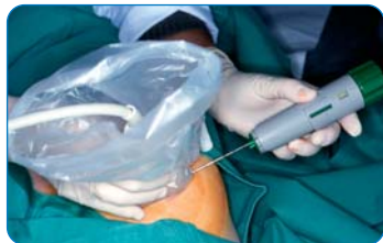
Microbiopsie guidée par échographie