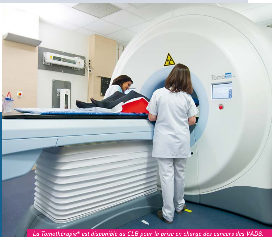
La Tomothérapie® est disponible au CLB pour la prise en charge des cancers des VADS.

LA RADIOTHÉRAPIE EST PRESCRITE SOIT POUR DES TUMEURS NON OPERABLES (ASSOCIÉE AVEC DE LA CHIMIOTHÉRAPIE OU AUTRE), SOIT EN POST-OPÉRATOIRE. LE CENTRE LÉON BÉRARD PROPOSE UN PLATEAU TECHNIQUE COMPLET POUR LA PRISE EN CHARGE DES TUMEURS DES VADS, AVEC UNE EXPERTISE PARTICULIÈRE DANS LES NOUVELLES TECHNOLOGIES QUI PERMETTENT UNE DIMINUTION DES SÉQUELLES À LONG TERME.