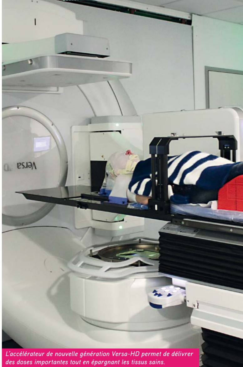
L'accélérateur de nouvelle génération Versa-HD permet de délivrer des doses importantes tout en épargnant les tissus sains.